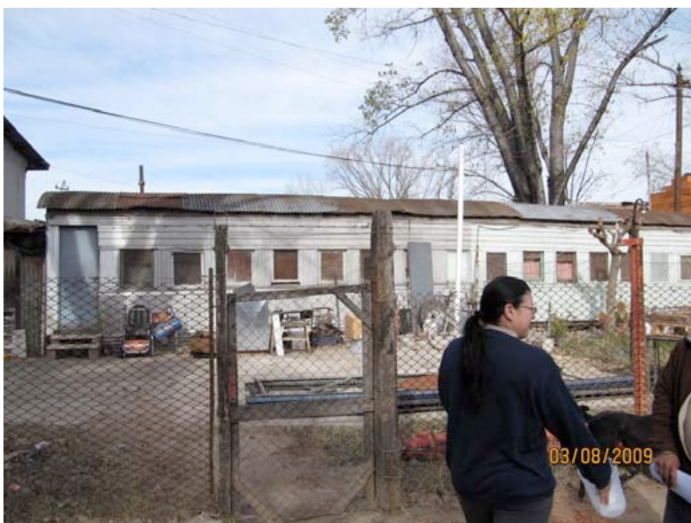
Vagón-vivienda Playon de Cacharita, Buenos Aires ( 3 8 2009)

Hace dos años, los vecinos juntaron más de 450 firmas y le llevaron peticiones al Gobierno de la Ciudad para que "reordenara la zona": pedían mayor seguridad y limpieza, más luz en Fraga y que se evitara la quema de elementos tóxicos (dentro del asentamiento hay un galpón que utilizan cientos de cartoneros).