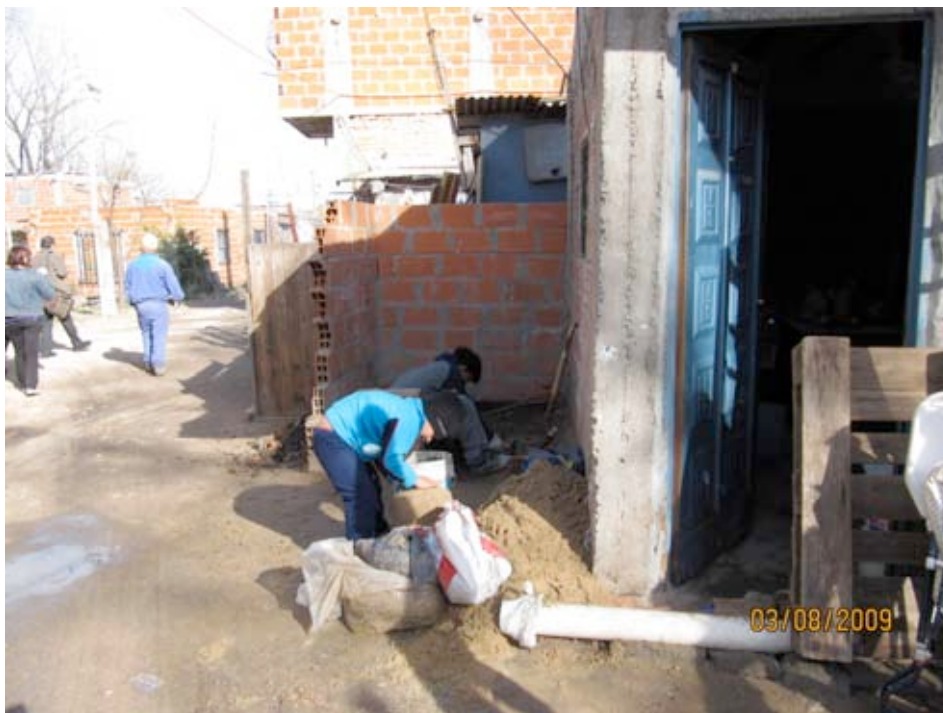
Construyendo su vivienda, Playon de Chacarita, Buenos Aires (3 8 2009)

pudo constatar la carencia total de infraestructura básica así como la extrema emergencia y vulnerabilidad social a la que se encuentran expuestos todos los grupos familiares alojados en este asentamiento.