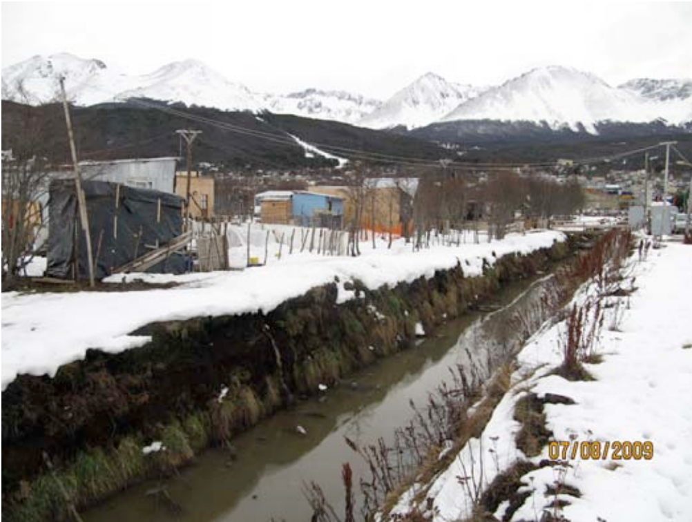
Barrio precario sobre el turbal, Lapataia, Ushuaia (7 8 2009)