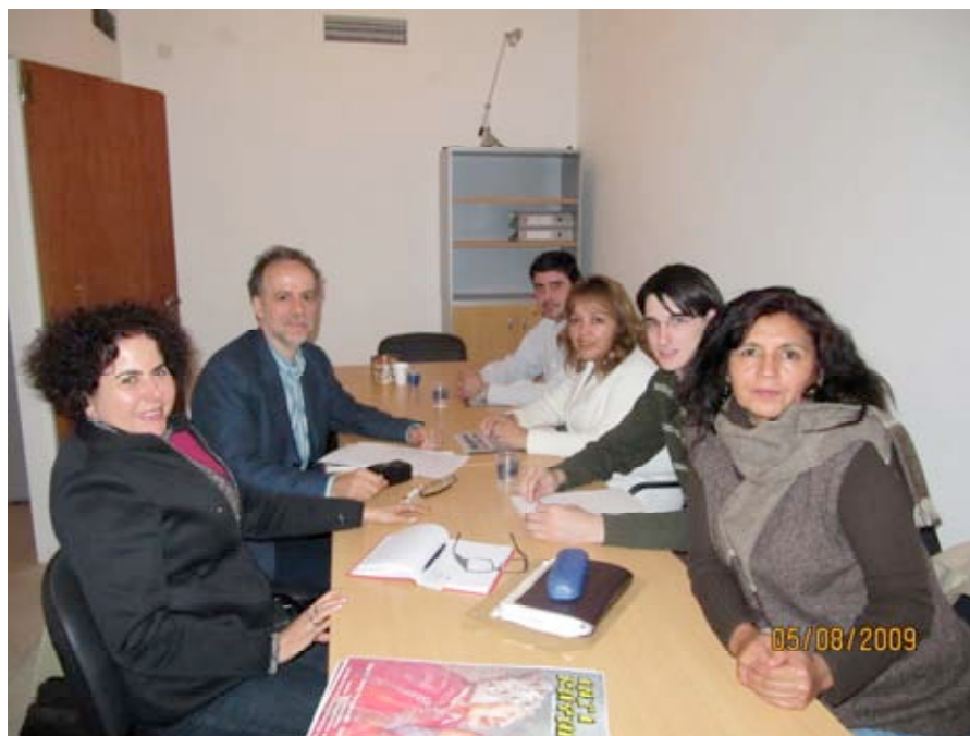
Encuentro Mision AGFE Comision Derechos Humanos Viedma (5 8 2009)

Participaron: Red Habitat Argentina, ONG El Ceibo, Coordinadora para Asentamientos Expontaneos AIH Paraguay Grito de los Excluidos, La Alianza Internaional de Habitantes, CTA – Tierra del Fuego, MOI,