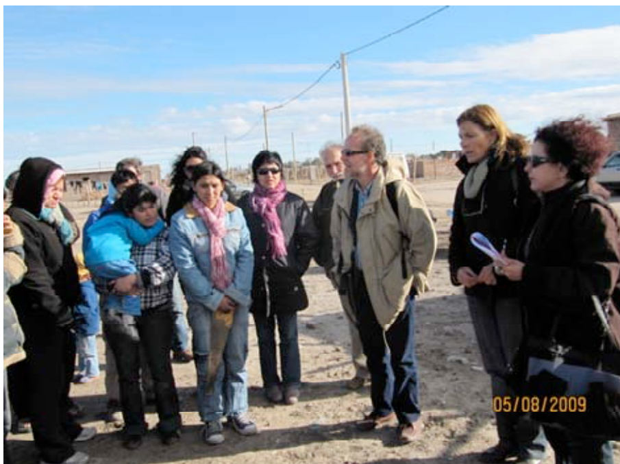
Encuentro Comision AGFE habitantes Barrio 30 de Marzo, Viedma ( 5 8 2009)

La Misión AGFE en visita a la Ciudad de Viedma, en los días 6 y 7 de agosto de 2009, recorrieron los barrios de Santa Clara, Loteo Silva, 30 de Marzo y Neuén, para conocer la realidad en que vive la población de bajos ingresos en estos barrios. Destaca que