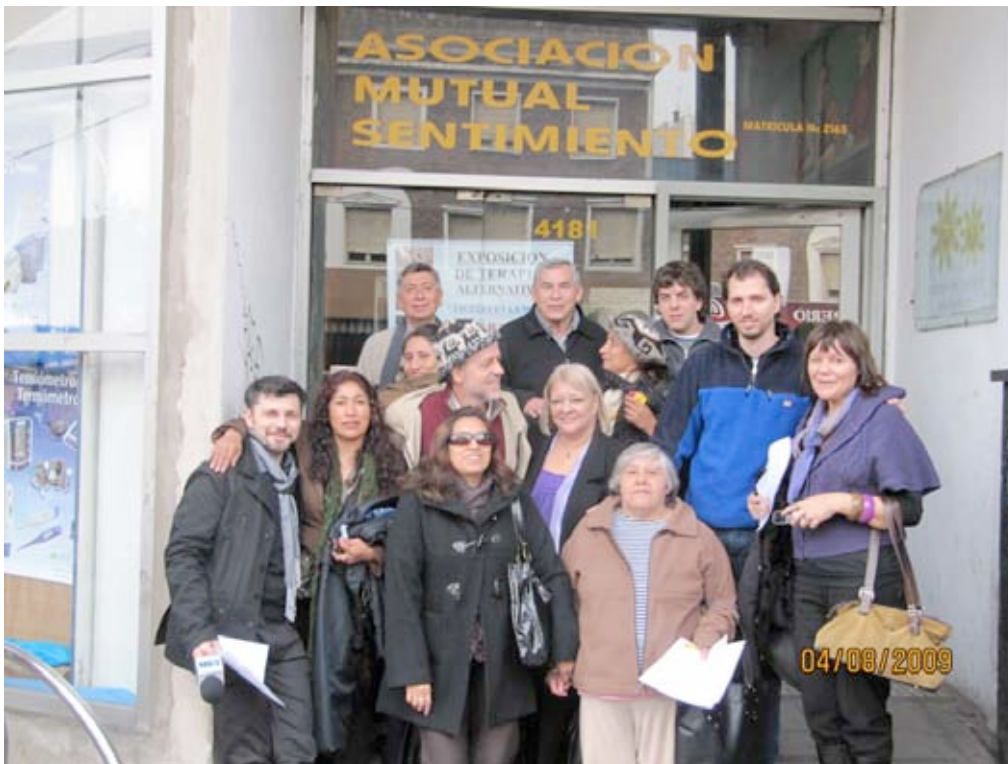
Mutual Sentimiento bajo desalojo, Buenos Aires (4 8 2009)

Después de cinco años, con 22 organizaciones trabajando en el edificio, una farmacia de medicamentos genéricos y la radio comunitaria Libre en funcionamiento, la mutual renovó el contrato hasta el 28 de abril pasado.