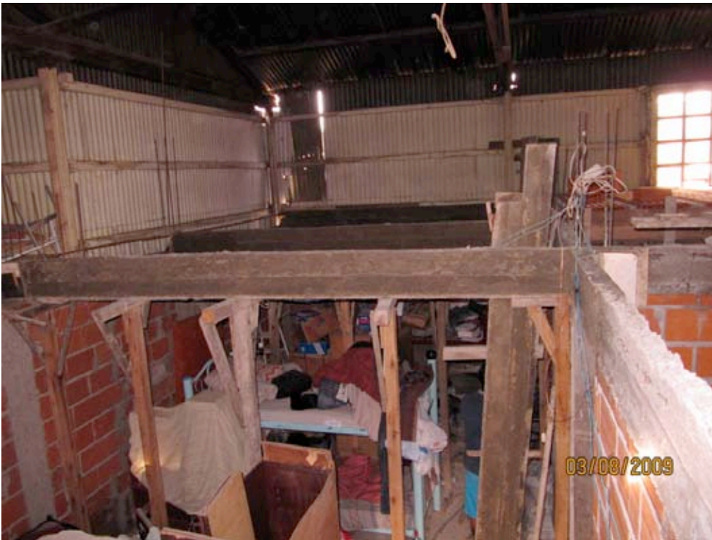
Camas bajo el galpon, Playon de Chacarita, Buenos Aires (3 8 2009)

Se mantuvieron diversas reuniones con los vecinos del asentamiento, con personal del Centro de Salud y Acción Comunitaria (Ce.S.A.C.) n° 33, con funcionarios del Programa de Salud Ambiental y del Plan de Atención Primaria de la Salud - dependientes del