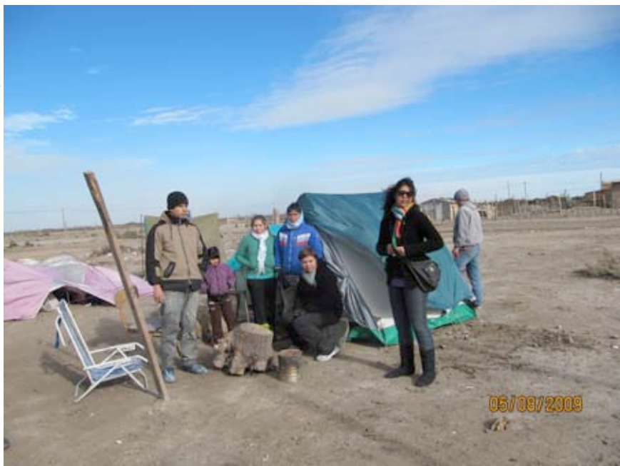
Toma de tierra al margen Barrio 30 de marzo, Viedma (5 8 2009)

Local de Salud (abril de 2009) una de las entidades que Forman parte del Foro Social por una Vida Digna al Intendente de la Ciudad de Viedma, el Consejo alerta que la realidad sanitaria es perjudicial para los habitantes y exigen que se realicen las medidas que correspondan a fin de equilibrar la situación precaria del barrio e propiciar condiciones de habitabilidad a las personas: "recolección de residuos; para evitar la quema de basura, y la distribución de agua potable en recipientes cerrados (bidones), que minimice los riesgos de contaminación de