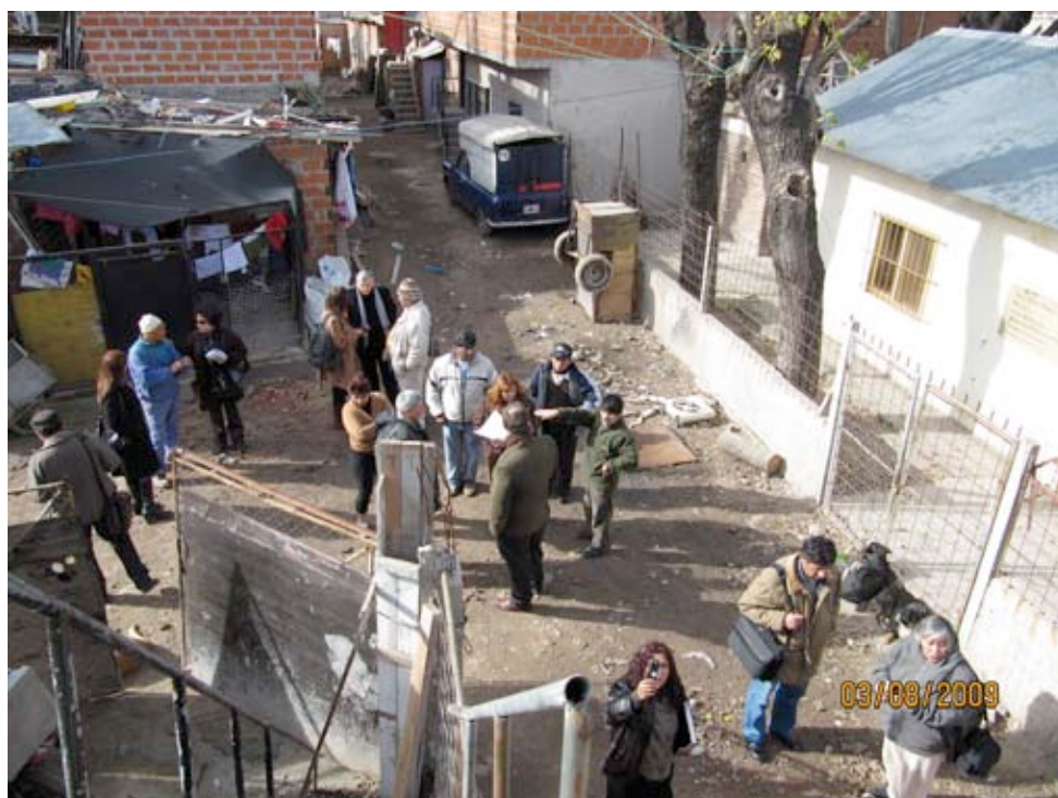
Visita Mision AGFE Playon de Chacarita, Buenos Aires (3 8 2009)

En la década de los setenta, la empresa ferroviaria estatal daba viviendas a sus trabajadores. Desde fines de los setenta, con la irrupción de los gobiernos de facto y luego con la agudización de los problemas económicos devenidos de las políticas neoliberales de los noventa, incluidas las políticas de privatización y concesión de la explotación de servicios públicos como los ferrocarriles, esa