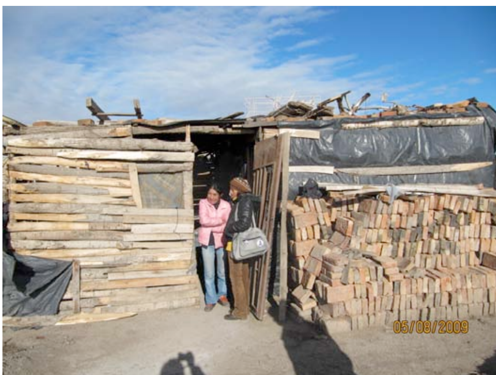
Autoconstruccion barrio 30 de marzo, Viedma (5 8 2009).