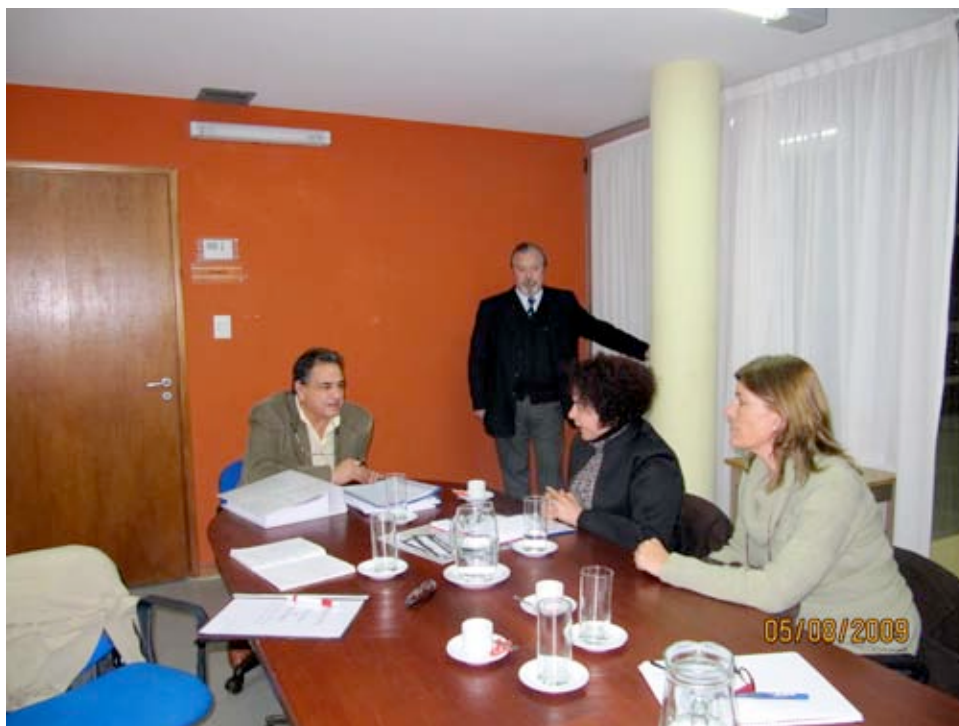
Encuentro Mision AGFE Intendente Viedma (5 8 2009)

debido al bajo poder adquisitivo de una parte de la población, principalmente con la crisis económica.