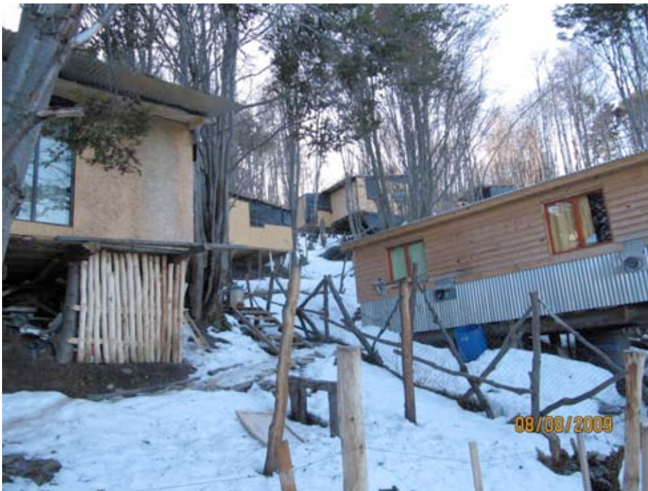
Construyendo Barrio Obrero, Ushuaia (8 8 2009)

Es un terreno que la figura legal es de transito y espera.