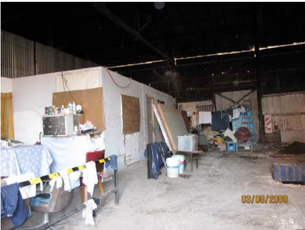
Viviendas bajo el galpon, Playon de Chacarita, Buenos Aires (3 8 2009)

Un otro problema es la falta de agua potable segura para el consumo humano. Al respecto, los vecinos manifestaron que la problemática se originaría por la carencia de una adecuada presión, ocasionada en la red externa de la empresa concesionaria. Refirieron que desde el día 2 de enero de 2008 se iniciaron los cortes del servicio transcurriendo jornadas completas sin contar con el mismo. Debido a ello, los vecinos deben abastecerse de agua a través del acarreo de baldes desde una estación de servicio y el cuartel de bomberos cercanos.