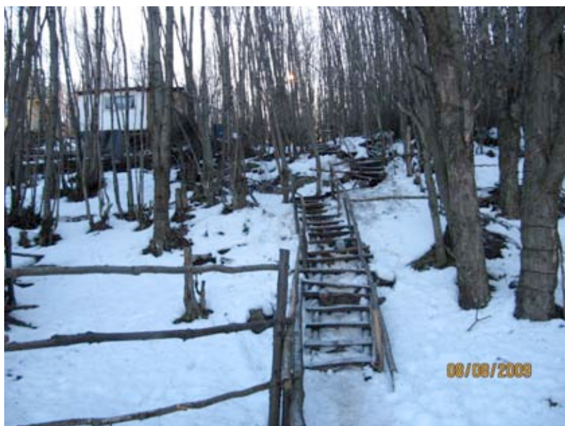
Escalas para caminar en el Barrio Obrero, Ushuaia (8 8 2009)