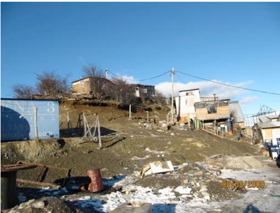
Barrio la Bolsita, Ushuaia (8 8 2009)

Se trata de 60 familias sobre terrenos municipales. Sin agua los chicos no pueden estar en condiciones de cargar botellones de agua sobre todo en ese terreno irregular: ley de protección a la infancia y adolescencia (ley 21161) Cloacas: hicieron ellos las conexiones