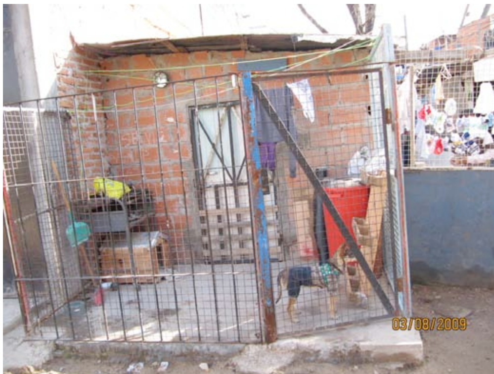
Playon de Chacarita, Buenos Aires ( 3 8 2009)

En otro orden de cosas, la empresa "La Monedita S.R.L." -la cual alquiló desde el día 22 de marzo de 2004 hasta el día 31 de marzo de 2007 los galpones identificados con los nros. 4023 y 4038 y una superficie a cielo abierto de 1.055 metros- inició una denuncia por usurpación a un