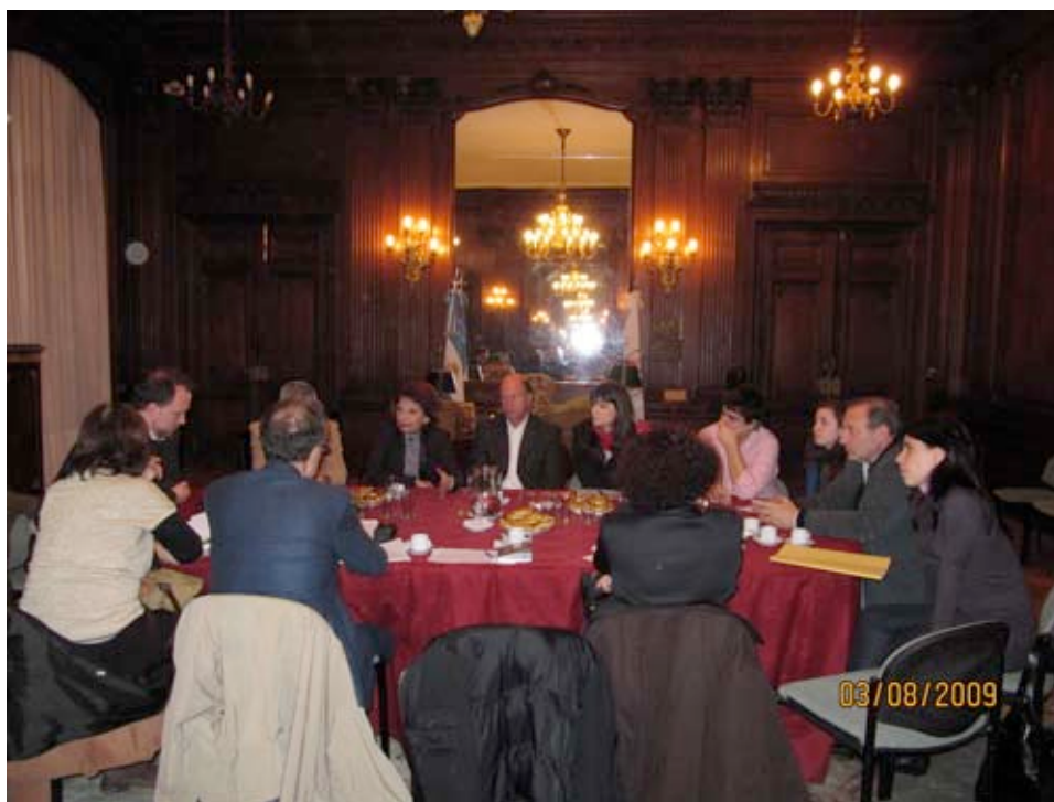
Encuentro Mision AGFE en Legislatura de Buenos Aires, Sal6n Eva Peron (3 8 2009).

En el sal6n Eva Peron de la Legislatura porte6a, previa la audiencia publica, se desarroll6 un intercambio entre los representantes de la misi6n y legisladores y representantes t6cnicos de la Comisi6n de Vivienda sobre la situaci6n de emergencia habitacional de la ciudad de Buenos Aires. Los legisladores hicieron incapi6 en la falta de comunicaci6n que tienen con el poder ejecutivo de la