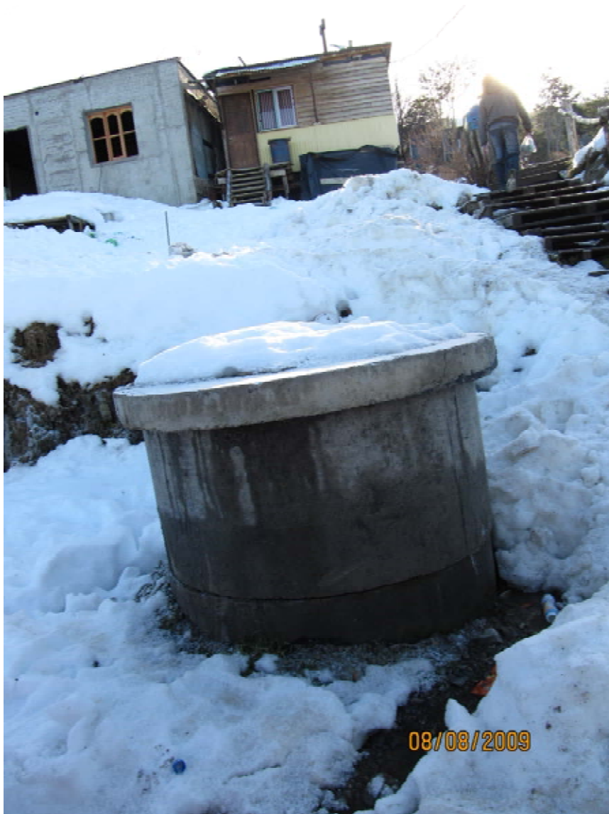
Sistema cloacal Barrio Obrero, Ushuaia (8 8 2009)

Transporte: no hay pero están cerca de zona céntrica, realizan actividades a pie, existen algunos autos.